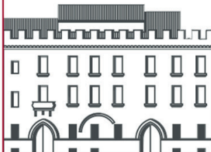
Palazzo Pepoli Museo della Storia di Bologna